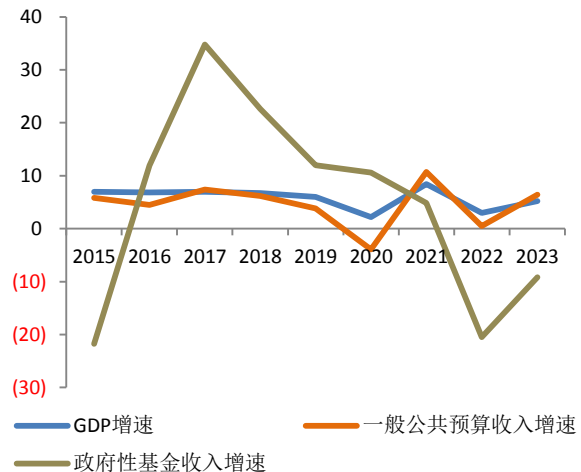
图 2：2015 年以来全国 GDP、一般公共预算收入、政府性基金收入增速（%）