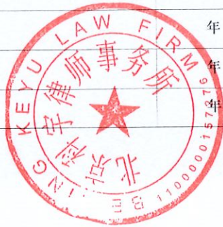
律师事务所变更登记 (六)